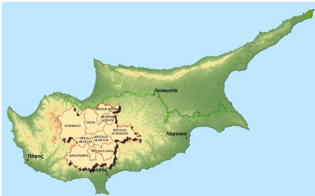
Εικόνα 1. Περιοχή Παρέμβασης

Η Περιοχή μελέτης βρίσκεται γεωγραφικά στο κέντρο σχεδόν της ελεύθερης Κύπρου και καλύπτει σημαντικό τμήμα του ορεινού όγκου του Τροόδους. Η συνολική έκταση της Περιοχής είναι 1.476,8Km 2 , ποσοστό 15,7% σε σχέση με τη συνολική έκταση του νησιού που είναι 9.251Km 2 , ή το 25% της ελεύθερης Κύπρου. Η περιοχή περιλαμβάνει 115 κοινότητες, οι περισσότερες των οποίων θεωρούνται οι πλέον ορεινές της Κύπρου.