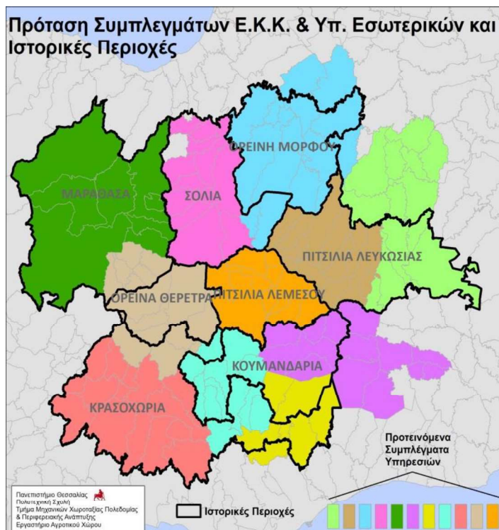
Εικόνα 6. Πρόταση Συμπλεγμάτων ΕΚΚ & Υπ. Εσωτερικών και όρια ιστορικών Περιοχών

Το νομοσχέδιο που κατέθεσε το Υπουργείο Εσωτερικών για την δημιουργία Συμπλεγμάτων Υπηρεσιών προτείνει τα συμπλέγματα που κατέθεσε η Ένωση Κοινοτήτων Κύπρου. Τα όρια των συμπλεγμάτων ταυτίζονται με τα όρια των ιστορικών περιοχών μόνο για τη Μαραθάσα, τη Σολέα και την Πιτσιλιά. Αντίθετα, τα Κρασοχώρια, τα Κουμανταροχώρια και η Βόρεια Πιτσιλιά διασπώνται. Το βόρειο τμήμα της πρώτης με κέντρο το Όμοδος ενσωματώνεται στα Ορεινά Θέρετρα, το ανατολικό τμήμα της Κουμανταρίας δημιουργεί ένα σύμπλεγμα με τις κοινότητες Αρακαπά, Συκόπετρας, Επταγωνίου, κτλ., το νότιο τμήμα συνιστά μόνο του Σύμπλεγμα με επίκεντρο την Πάχνα, ενώ το ανατολικό τμήμα των Κρασοχωρίων με μέρος των κοινοτήτων των Κουμανταροχωριών, συνιστούν το κεντρικό Σύμπλεγμα του νότιου Τροόδους. Το ανατολικό τμήμα της Βόρειας Πιτσιλιάς δημιουργεί Σύμπλεγμα με τις όμορες και γειτονικές κοινότητες (εκτός περιοχής Τροόδους) της Κλήρου, Καλό Χωριό, Μιτσερό κτλ., και η υπόλοιπη Πιτσιλιά συνιστά Σύμπλεγμα μόνη της. Τέλος, η περιοχή Ορεινής Μόρφου δημιουργεί Σύμπλεγμα με τις όμορες μεγάλες κοινότητες του Αστρομερίτη και Περιστερώνα.