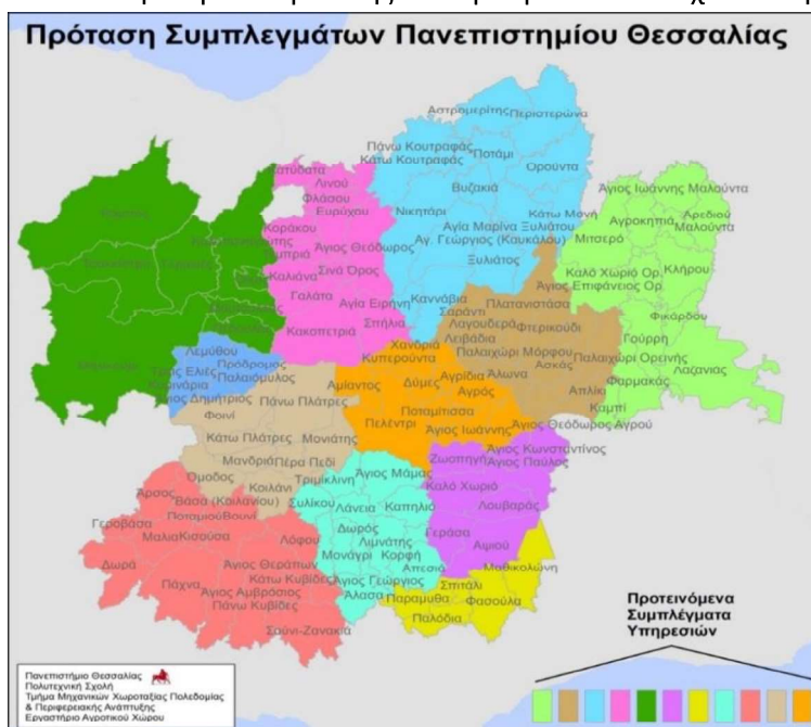
Εικόνα 7. Πρόταση Συμπλεγμάτων Πανεπιστημίου Θεσσαλίας

Οι τροποποιήσεις αυτές αφορούν την δημιουργία συμπλέγματος Νότιας