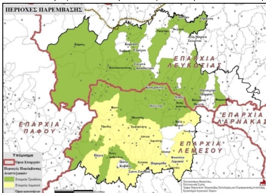
Εικόνα 8 : Αναπτυξιακές Εταιρείες Τρόόδου και Λεμεσού

Ως προς την διαδικασία λήψης αποφάσεων προτείνεται ένα ελαφρό και ευέλικτο εταιρικό σχήμα δηλαδή να διευθύνεται από ένα 5μελές ή 7μελές Διοικητικό Συμβούλιο. Το Συμβούλιο αυτό θα απαρτίζεται από εκπροσώπους των εταιρών του οποίου η σύνθεση προτείνεται να